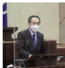
令和 4 年 12 月議会

1 2 月議会で、この問題を取り上げ、孤独・孤立に悩む人を誰一人取り残さない社会を目指して、プロジェクトチームの設置や重層的な支援など、積極的な取り組みを求めました。