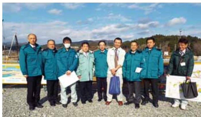
南三陸町の土地区画整理事業現場にて

今後とも、被災地全体の日も早い復興に仙台市としても貢献できるよう、議会の立場から取り組んでまいります。